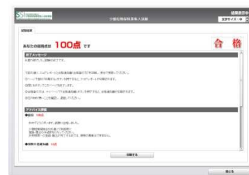
CBT試験画面のイメージ※画面は開発中のもので実際の試験とは異なります。