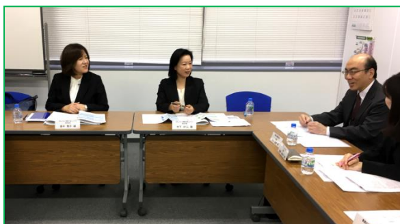
※選定委員会の様子